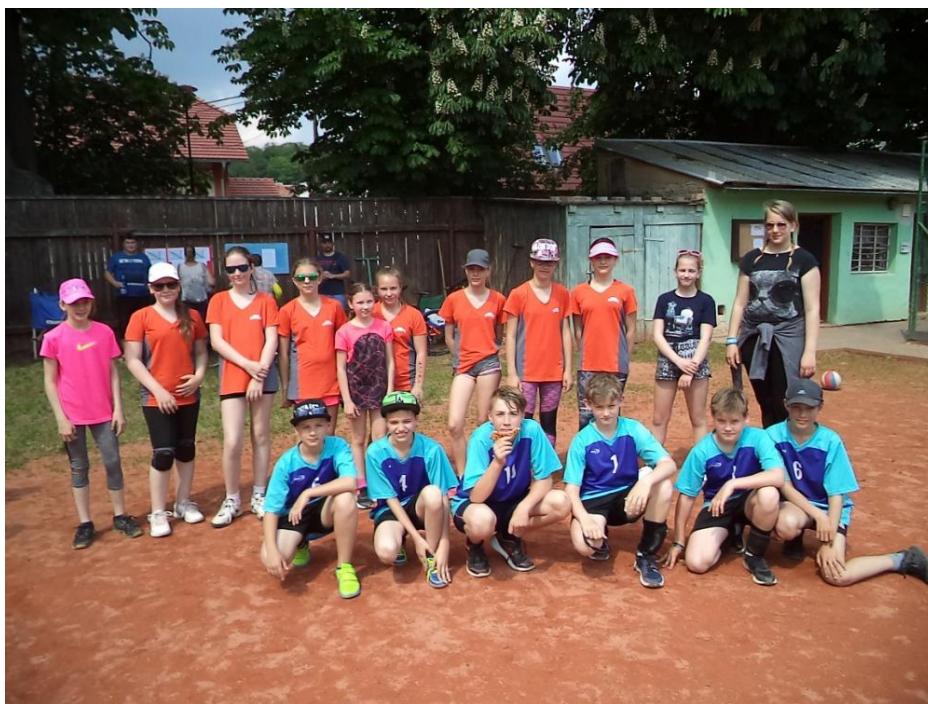
Bučovická přípravka DDM a Sokola Bučovice

Z výsledků je vidět, že domácí ovládli turnaj hned v několika kategoriích. Děvčata hrála pod hlavičkou DDM Bučovice a kluci pod T. J. Sokol Bučovice. Všechny děti byly odměněny dokonce dvěma medailemi, a to keramickou z dílny DDM Bučovice a „opravdicovou“ kovovou, dále diplomem a spoustou věcných cen. A aby nebe ukázalo, jak moc shovívavé bylo, pět minut po rozdělení posledních cen se na nás opět spustily dešťové kapky.